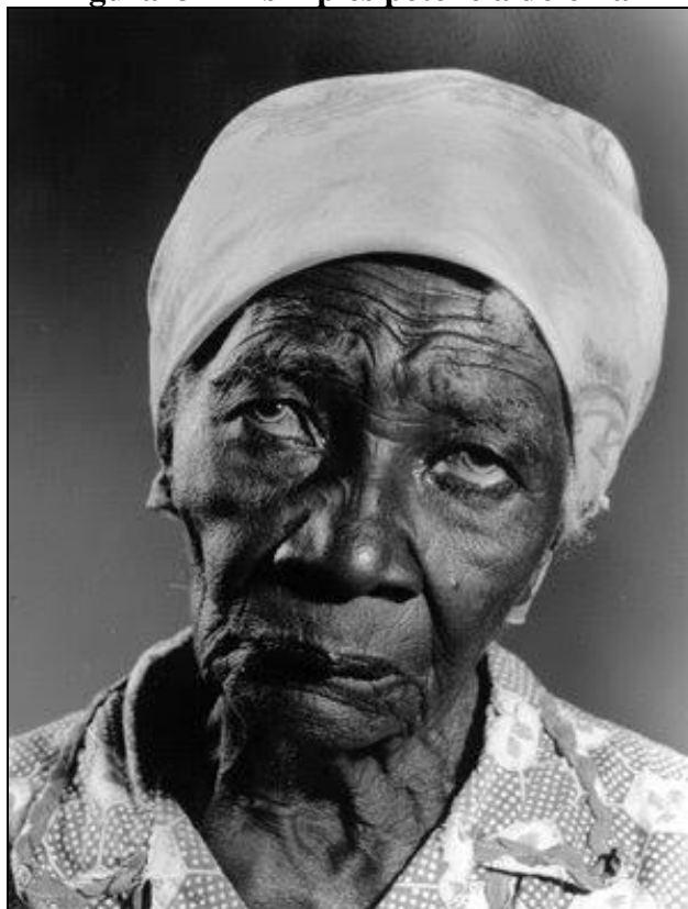
Figura 3 – A simples potência do olhar

Fonte: Fotografia de Januário Garcia. Disponível em: < https://projetoafro.com >.