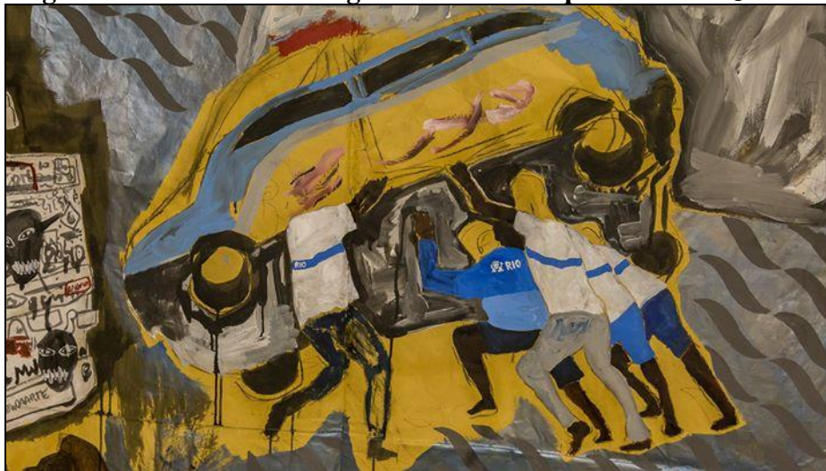
Figura 4 - Conflitos e insurgências do município do Rio de Janeiro

Fonte: Pintura de Maxwell Alexandre. Disponível em: < https://revistacontinente.com.br >.