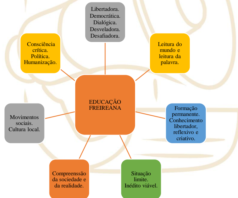
Imagem 1 - Mapa conceitual para princípios da educação freiriana