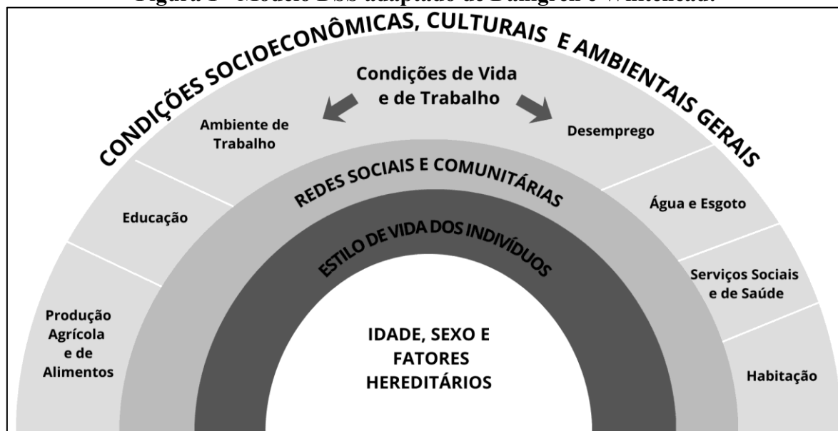
Figura 1 - Modelo DSS adaptado de Dahlgren e Whitehead: