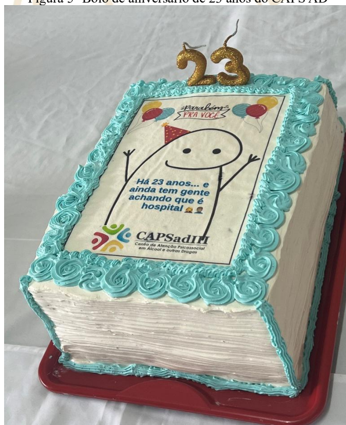
Figura 5- Bolo de aniversário de 23 anos do CAPS AD

Além das assembleias, outro aspecto observado é o esforço da equipe em planejar atividades e festividades que levem em conta os interesses e preferências dos usuários. As comemorações, como a festa de aniversário do CAPS, não são apenas momentos de lazer, mas também de integração e fortalecimento de vínculos entre usuários e equipe. Nessas ocasiões, todos os usuários são convidados a participar, interagir e se divertir, proporcionando experiências que combinam cuidado, acolhimento e diversão. Essas atividades reforçam a ideia de que o CAPS AD não é apenas um espaço de tratamento clínico, mas também um território de convivência, escuta e humanização, no qual os usuários têm seu lugar de fala reconhecido e valorizado, como evidenciado no próprio bolo do aniversário da instituição.