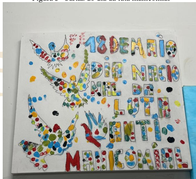
Figura 3- Cartaz do dia da luta manicomial

Os cartazes, produzidos e expostos pelos próprios usuários, reforçam essa dimensão política e educativa do espaço. Mais do que elementos decorativos, esses materiais operam como atos discursivos de resistência, transformando o espaço institucional em território de expressão, memória e cidadania. Além disso, cartazes produzidos no dia Nacional da luta antimanicomial pelos próprios usuários, também demonstram, como a conscientização acerca da temática é amplamente abordada pelos profissionais.