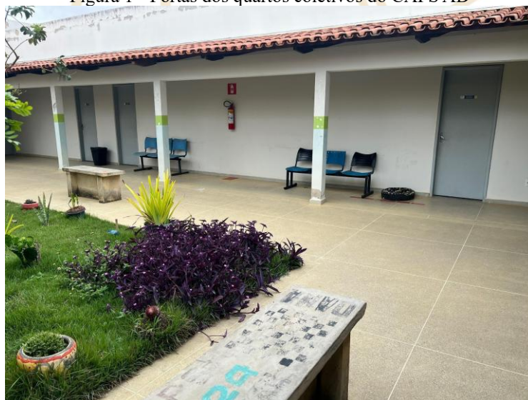
Figura 1 - Portas dos quartos coletivos do CAPS AD

Partindo da concepção de (ULLOA, 1995), de que as instituições não são neutras, as observações de campo revelam que a humanização também se materializa na organização espacial e estética do CAPS AD. Nenhum espaço da instituição possui grades nem nas janelas, tampouco nas portas dos quartos coletivos 1 como pode ser observado na figura 1.