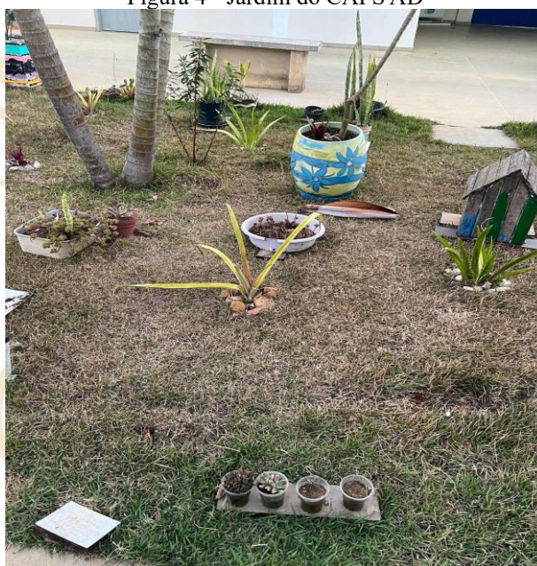
Figura 4 - Jardim do CAPS AD

O ambiente físico do CAPS AD analisado desempenha papel central na produção da humanização, atuando como um dispositivo ético, pedagógico e político do cuidado em liberdade. No pátio central, destaca-se a presença de um jardim amplo, colorido e cuidadosamente mantido, espaço de circulação, descanso e convivência entre usuários e profissionais. Mais do que um elemento decorativo, o jardim opera como um território terapêutico, no qual a experiência do cuidado se realiza de forma sensível, não coercitiva e integrada à vida cotidiana.