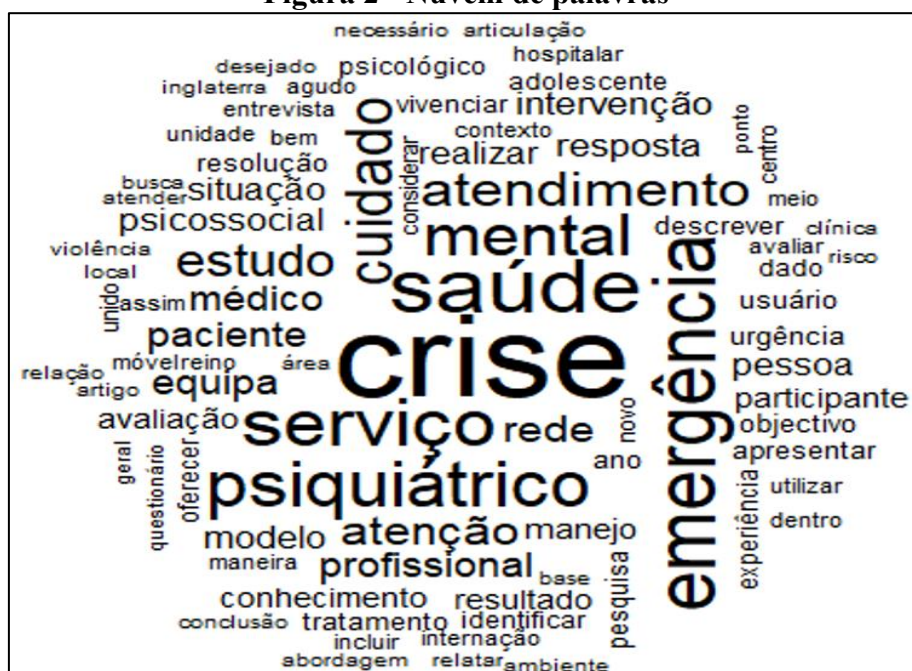
Figura 2 - Nuvem de palavras

A partir dos resumos dos estudos incluídos, foi elaborado um corpus textual composto por 11 segmentos de texto, com um total de 2.783 ocorrências de palavras. Foram identificadas 966 formas únicas de palavras, das quais 646 são hapax, representando 66.87% das formas e correspondendo a 23.21% das ocorrências no corpus . Na Figura 2 é apresentada a nuvem de palavras constituída de termos com frequência acima de quatro. As palavras maiores, como: crise (55); Saúde (34); Emergência (33); Serviço (30); Psiquiátrico (28); Mental (24); Cuidado (22); Atendimento (19); Atenção (15); Rede (13), enquanto a palavra “Urgência” teve um número de 7 ocorrências, apontando para a compreensão de que esse fenômeno ainda aparece de forma subjacente.