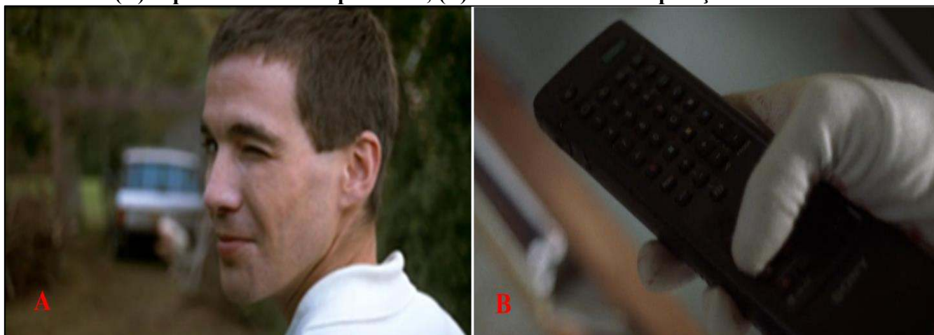
Figura 3 – Arquivo iconográfico: (A) A piscadela da cumplicidade; (B) O controle da manipulação narrativa

Na cena mais radical do filme, a esposa consegue pegar uma espingarda, atirar e matar Peter. No entanto, Paul inesperadamente pega um controle remoto e literalmente rebobina a cena, anulando a tentativa de reação e restaurando a dominação absoluta dos agressores sobre a narrativa (Figura 3B). Na nova versão da cena, os jovens impedem o disparo e mantêm o controle da situação.