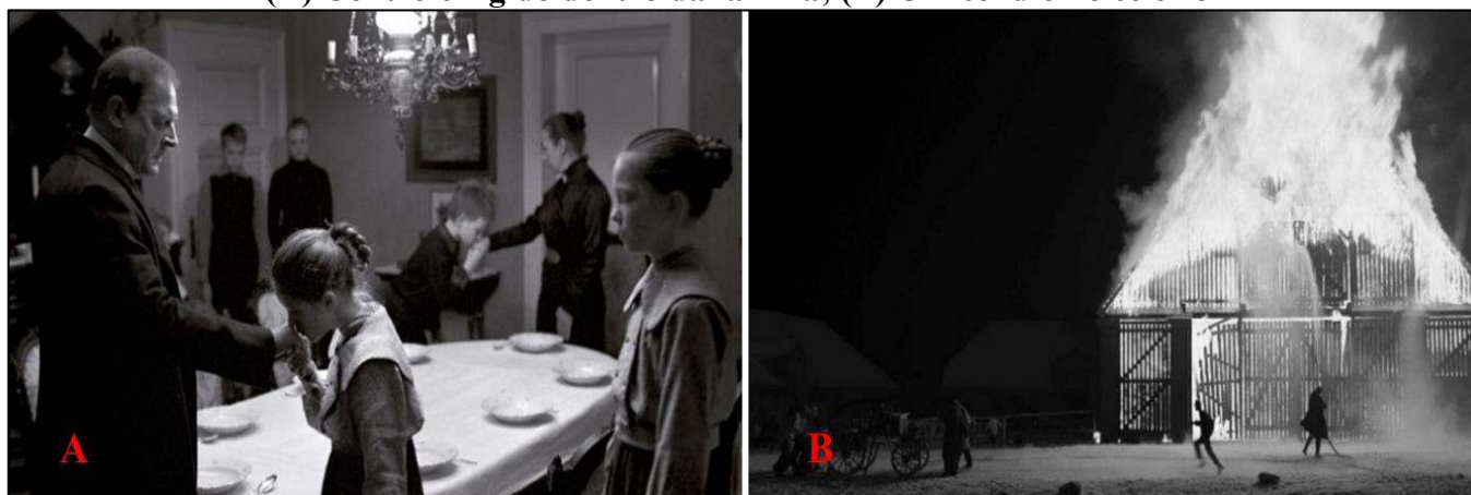
Figura 5 – Arquivo iconográfico: (A) Controle rígido dentro da família; (B) O incêndio no celeiro

Na casa do barão, embora com menor exposição direta, a violência se manifesta na exploração e no descaso com os trabalhadores, o que resulta em diversas tragédias, como o suicídio de um camponês após perder a esposa. Essa estrutura social gera fraturas profundas, que se estendem para o cotidiano da vila.