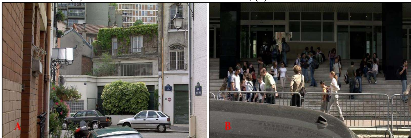
Figura 4 – Arquivo iconográfico: (A) A câmera fixa filma a fachada da casa; (B) O desfecho aberto

Paralelamente, o relacionamento entre Georges e Anne se deteriora. Pierrot desaparece por um tempo, levantando suspeitas de sequestro, mas logo retorna sem dar maiores explicações. A tensão entre os membros da família aumenta, revelando rachaduras internas que não estavam visíveis no início do filme. Anne se mostra cada vez mais distante, dando indícios de uma possível traição, e Georges escolhe não falar sobre o passado, nem com sua família, nem consigo mesmo.