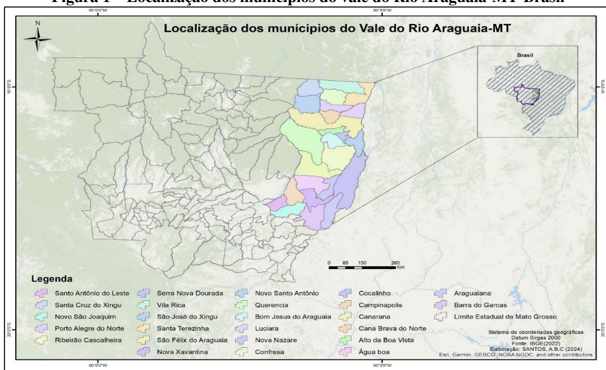
Figura 1 – Localização dos municípios do vale do Rio Araguaia-MT-Brasil

O presente estudo exploratório é caracterizado como descritivo e explicativo quanto aos fins e possui natureza qualiquantitativa quanto aos meios (CRUZ et al. , 2022), a fim de avaliar a relação da economia e meio ambiente no município de Querência, no estado de Mato Grosso, Brasil, utilizando a Análise Envoltória de Dados (DEA), inserido em um universo de 25 municípios analisados. Para isso, adotou-se uma abordagem qualitativa e quantitativa (XUE, et al. , 2022; OLIVEIRA, et al. , 2024), com ênfase especial nas características e particularidades ambientais de Querência. Com isso, o trabalho pretende fornecer subsídios para a formulação de estratégias mais eficazes de planejamento e conservação ambiental em regiões similares. A figura 1 mostra os locais do estudo.