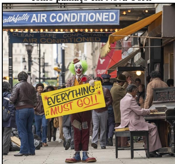
Figura 1 - Arthur Fleck trabalhando como palhaço em Nova York

O Filme norte-americano Joker , dirigido por Todd Phillips e lançado em 2019, retrata o drama o vivido por Arthur Fleck (interpretado por Joaquin Phoenix) na cidade de Gotham, uma cidade, em que pese dita “fictícia”, com diversos problemas sociais. O personagem trabalha para uma agência de alugueis de palhaços chamada Haha's , que aparentemente não remunerar bem os seus colaboradores. Ainda na introdução do filme, enquanto trabalha na rua já fantasiado de palhaço, Arthur dança ao som do piano em frente a uma loja de instrumentos musicais segurando uma placa com os dizeres “ everything must go ” (Figura 1).