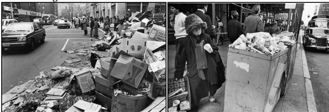
Figura 6 - Lixo nas ruas de Nova York na década de 1980

ao ataque sobre a classe trabalhadora de Nova York e a supressão do poder negro militaram contra a realização dos objetivos da elite financeira. Tampouco a classe trabalhadora de Nova York sucumbiu sem uma batalha. Greves deixaram o lixo exposto e apodrecendo nas ruas (Figura 6), a manutenção do metrô se deteriorou, e os sindicatos da polícia e dos bombeiros lançaram uma campanha da “Cidade do Medo” que enfatizou os perigos pela falta de segurança na cidade aos turistas (HARVEY et al. , 2009).