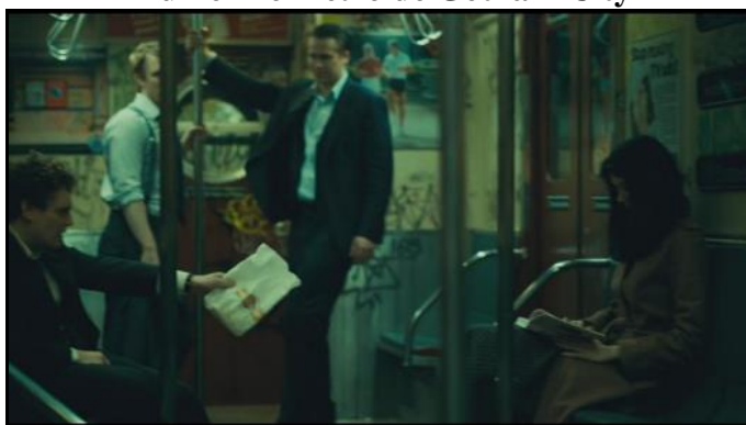
Figura 4 - Três homens e uma mulher no metrô de Gotham City