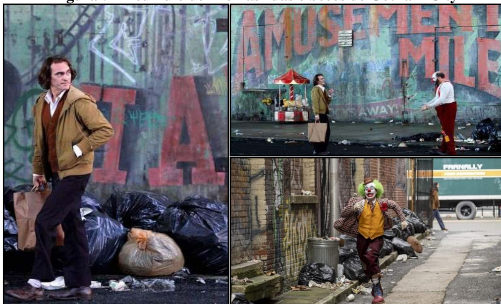
Figura 5 - Acúmulo de lixo nas ruas e becos de Gotham City

Gotham é uma cidade sombria e perversa, marcada pela desigualdade social e à beira de um caos político. Há uma greve de lixeiros e, devido ao acúmulo de lixo nas ruas da cidade (Figura 5), ocorre uma infestação de ratos. A metáfora dos ratos e do ar fétido refere-se à elite e à classe política psicopática de Gotham, insensíveis ao sofrimento de seus cidadãos (FIGUEIREDO; MORONTE, 2022).