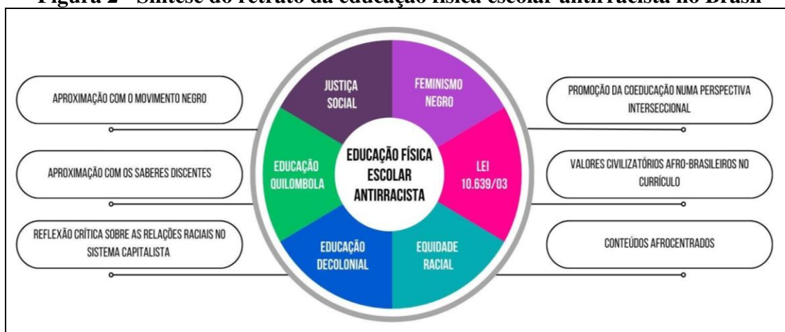
Figura 2 - Síntese do retrato da educação física escolar antirracista no Brasil

propostas estudadas, incorpora princípios fundamentais. Esses princípios convergem com a concepção de educação antirracista apresentada por Dei (2008), compreendendo tanto os processos de investigação quanto as práticas pedagógicas. Os princípios podem ser visualizados na figura a seguir: