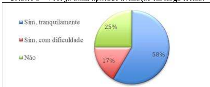
Gráfico 1 – Você já tinha aplicado avaliação em larga escala?

Já em relação a experiência com avaliação em larga escala, de acordo com as informações dos nossos colaboradores, 25% deles ainda não tinham aplicado a prova, conforme o Gráfico 1.