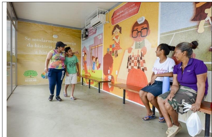
Figura 2 - Serviço de assistência às mães e filhos da Primeira Infância em Boa Vista-RR