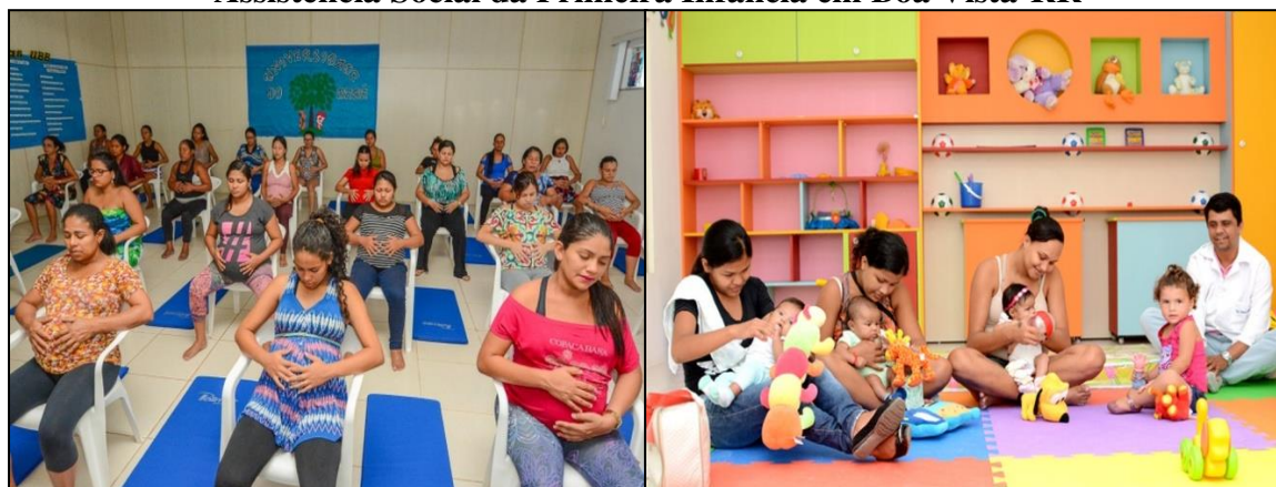
Figura 4 - Serviços oferecidos na área da Assistência Social da Primeira Infância em Boa Vista-RR