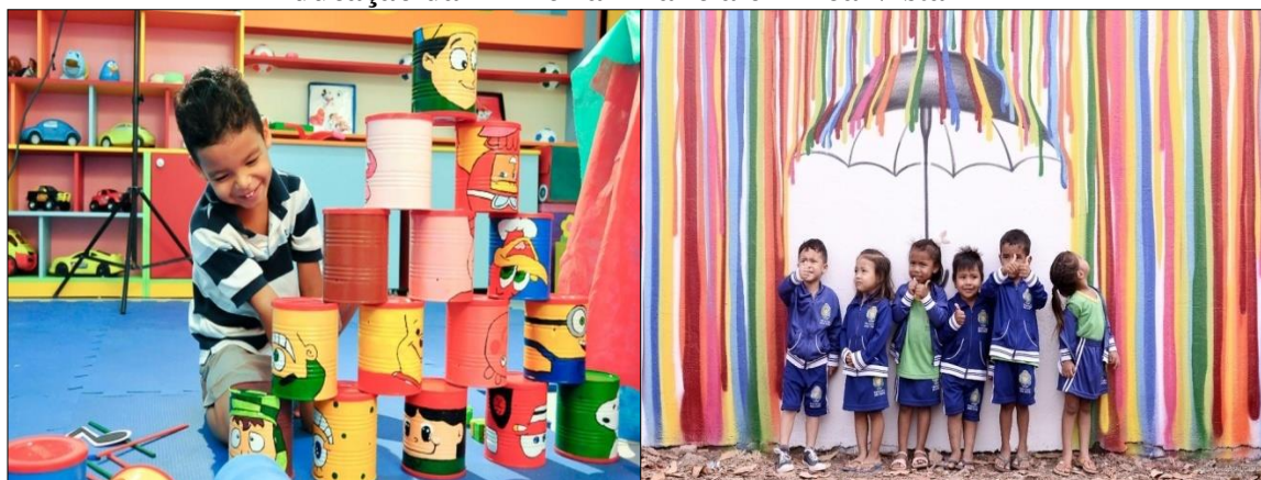
Figura 3 - Serviços oferecidos na área da Educação da Primeira Infância em Boa Vista-RR