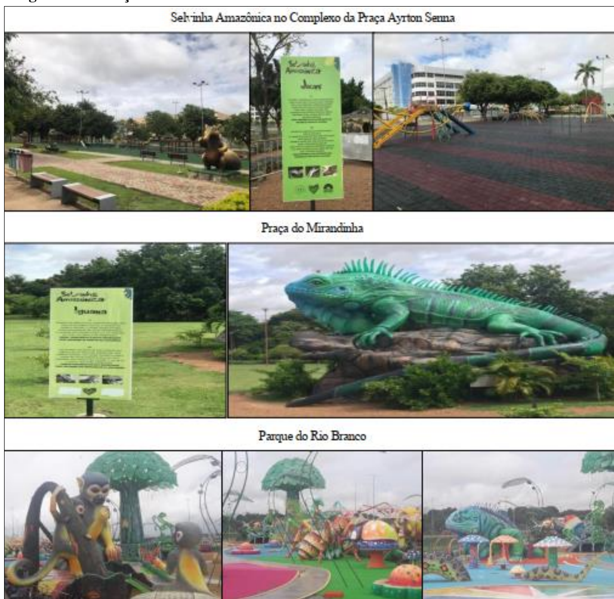
Figura 6 - Serviço na área da assistência social da Primeira Infância em Boa Vista-RR

Outra novidade que ganhou grande relevância e publicidade, são os espaços temáticos como a Selvinha Amazônica no Complexo Ayrton Senna, Praça do Mirandinha, e o Parque do Rio Branco. Conforme se observa na Figura 6, o Plano de Políticas Públicas de investimentos na Primeira Infância em Boa Vista, tem buscado contemplar de forma integral os direitos básicos de proteção e segurança à primeira infância que compreende o direito à vida, à saúde, à alimentação, à educação, ao lazer, à profissionalização, à cultura, à dignidade, ao respeito, à liberdade e à convivência familiar e comunitária. Dessa forma, Boa Vista se destaca no cenário nacional como modelo de implantação do primeiro Currículo Infantil do Brasil que atende as definições da Base Nacional Comum Curricular, para melhorar a qualidade de vida e o desenvolvimento pleno infantil (Figura 6).