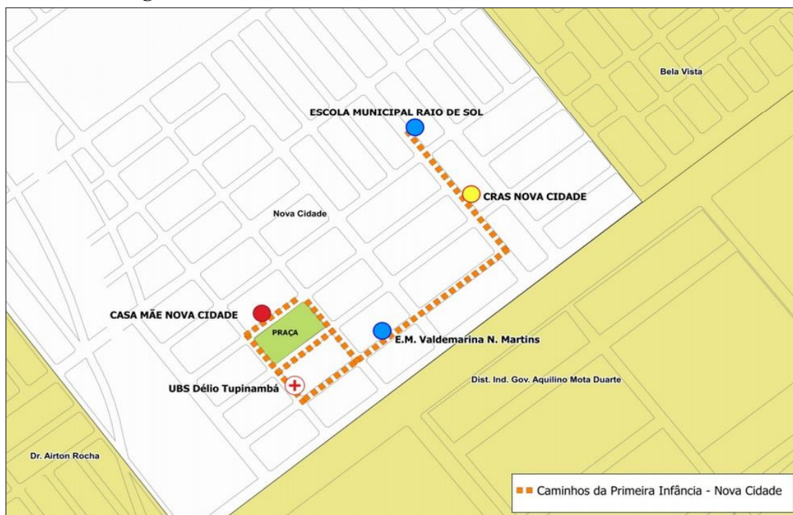
Figura 5 - Caminho da Primeira Infância em Boa Vista-RR