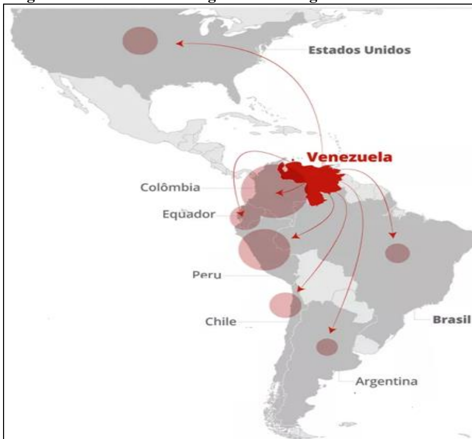
Figura 2 - Perfil do fluxo migratório e refugiados de venezuelanos

vida em detrimento da escassez de itens básicos no seu país de origem ou mesmo em função de eventuais perseguições políticas.