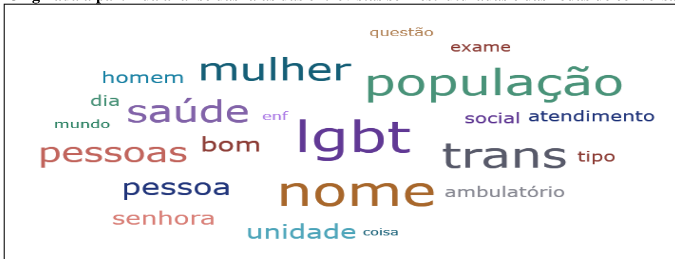
Figura 4 - Nuvem de palavras do eixo potencialidades, geradas pelo software Atlas ti. Originada a partir da análise das falas das entrevistas semiestruturadas e das rodas de conversa

A análise lexical das potencialidades que o território tem para o cuidado em saúde de pessoas LGBTQIA+ destaca a maior frequência das seguintes palavras: “LGBT” com 34 aparições, “nome” 32 aparições, “população” com 29 aparições, “trans” 28 aparições, “mulher” 25, “saúde” 24 aparições e as palavras “pessoa” e “pessoas” que juntas somaram 41 aparições, como demonstrado na figura a seguir: