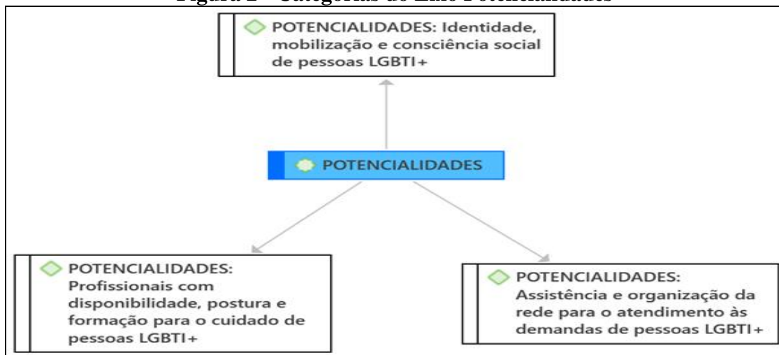
Figura 2 - Categorias do Eixo Potencialidades

Na análise temática de conteúdo, no eixo das potencialidades, foram contempladas três categorias: Assistência e organização da rede para o atendimento às demandas de pessoas LGBTQIA+; Identidade, mobilização e consciência social de pessoas LGBTQIA+ e; Trabalhadores e trabalhadoras de saúde com disponibilidade, postura e formação para o cuidado de pessoas LGBTQIA+ (Figura 2).