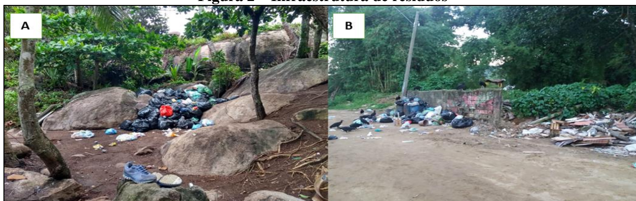
Figura 2 – Infraestrutura de resíduos

Além dessa situação, a questão da coleta de lixo, responsabilidade da Prefeitura de Angra dos Reis, é mais uma questão que incomoda moradores, turistas e impacta negativamente o meio marinho. Devido à dificuldade de acesso a esta praia e à baixa regularidade da coleta de resíduo sólido (uma vez por semana e por vezes demorando até duas semanas para a recolha) por meio de barco, resultou em um depósito de resíduos ao ar livre perto das docas. Então, na chegada da praia, já ocorre um impacto visual negativo e o cheiro é forte. Muitos turistas sentem e relataram nas entrevistas (Figura 2A). O acúmulo de lixo provoca mau cheiro e, quando chove, parte do resíduo e do lixiviado (também conhecido como chorume) são arrastados para o mar.