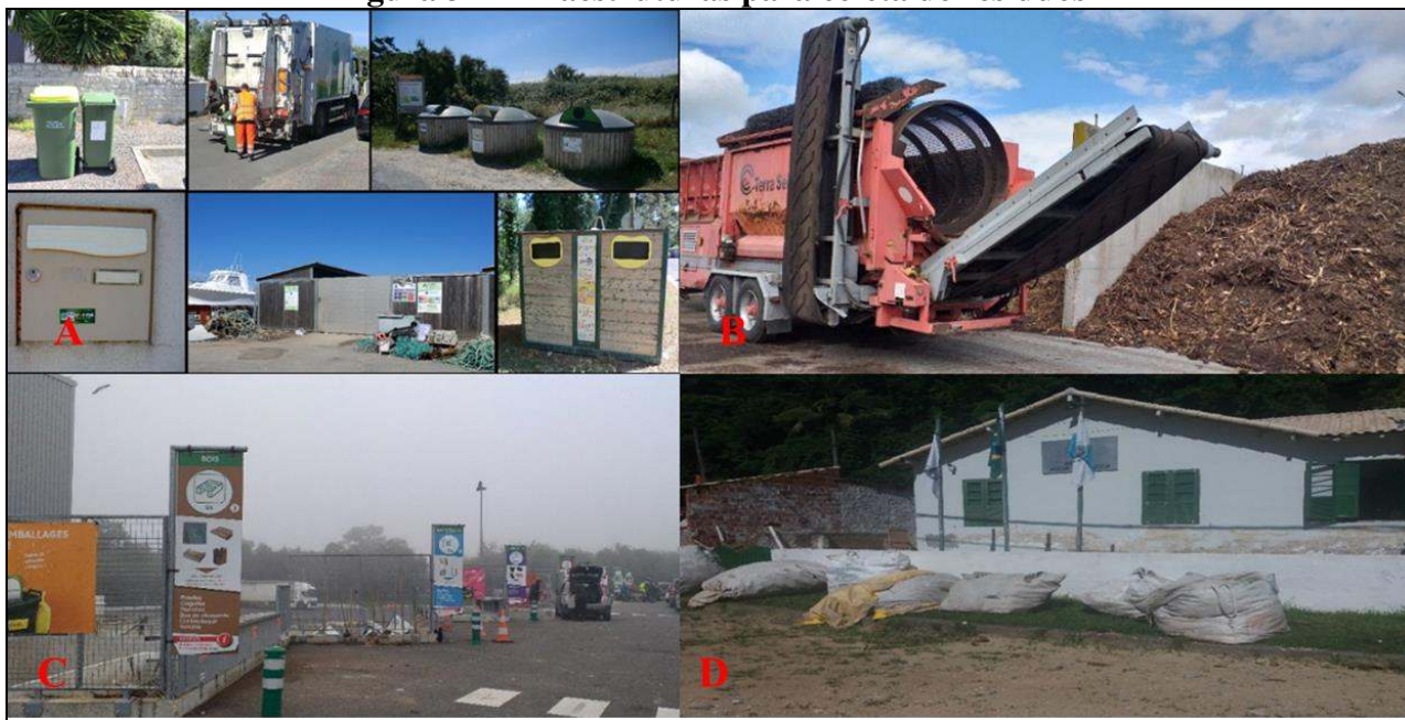
Figura 3 – Infraestruturas para coleta de resíduos

Tais como: (i) os alunos nas escolas foram sensibilizados para a redução do desperdício; (ii) animações em supermercados para promoção de produtos com menos embalagens; (iii) fornecimento de xícaras retornáveis (com logotipo do município) para eventos ao ar livre; (iv) o aquecimento de edifícios públicos (e também do parque aquático recreativo Iléo) foi realizado com combustíveis reciclados em 2011; (v) proibição de depósitos de lixo não autorizados com multas que variam de 450 a 1500 €, dentre outros.