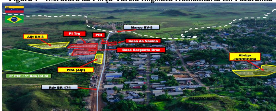
Figura 1 - Estrutura da Força-Tarefa Logística Humanitária em Pacaraima

Pacaraima também possui um alojamento de passagem (BV-8) que é destinado para abrigamento temporário dos migrantes venezuelanos não indígenas que estão em trânsito para Boa Vista. Esse alojamento possui instalações para atender ao público masculino, feminino e famílias constituídas, além de uma área para convivência e apoio (BRASIL, 2019). Possui um abrigo para indígenas (Janokoida) e, também, um Posto de Recepção e Apoio (PRA), cuja finalidade é atender os migrantes e refugiados não abrigados. Ali há locais para banho, instalações sanitárias, guarda-volumes, locais de distribuição de doações e alimentos e refeitório. Ademais, são fornecidas informações sobre regularização de documentos, interiorização e acesso aos serviços no Posto de Triagem. A estrutura da Operação Acolhida em Pacaraima pode ser melhor visualizada conforme a figura 1.