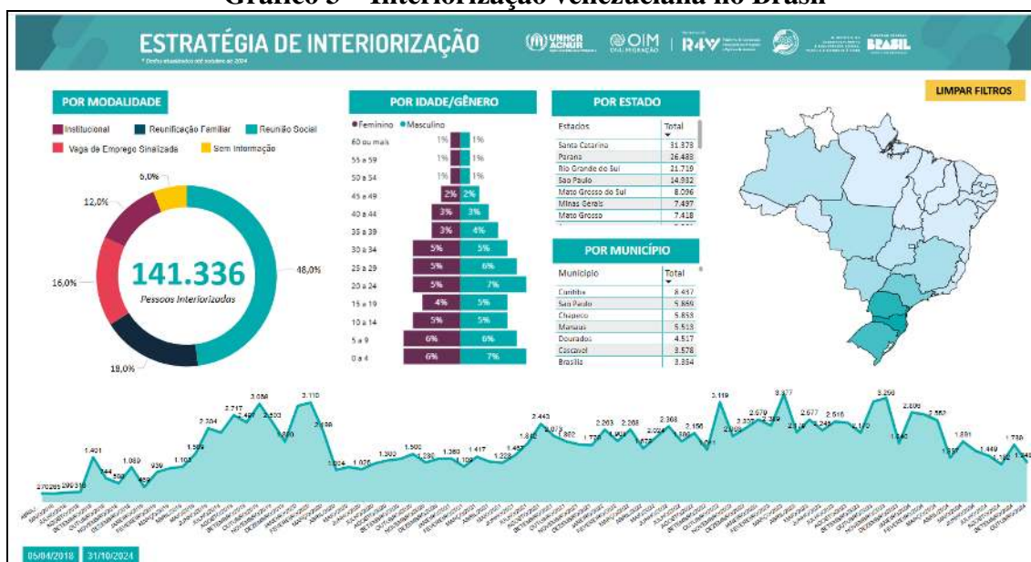
Gráfico 3 – Interiorização venezuelana no Brasil

Desde o início da Operação Acolhida, em 2018, o processo de interiorização se tornou uma das principais ferramentas para garantir a distribuição e integração desses migrantes em diferentes regiões do Brasil. Entre as principais regiões que receberam essas pessoas estão Santa Catarina, com 31.373 pessoas, seguido por Paraná (26.483), Rio Grande do Sul (21.719), São Paulo (14.932), Mato Grosso do Sul (8.096), Minas Gerais (7.497), etc. Esses estados se destacam pela combinação de fatores socioeconômicos favoráveis, como uma infraestrutura desenvolvida, acesso a serviços básicos, e uma