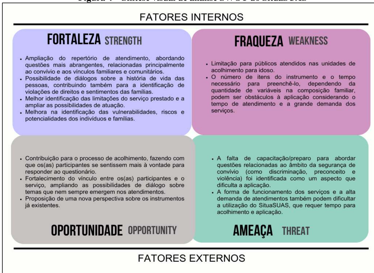
Figura 4 – Síntese visual de análise SWOT do SituaSUAS

Como resultado da análise de aplicabilidade do instrumento, a partir da percepção das(os) aplicadoras(es), foram identificados facilitadores (fortalezas e oportunidades) e barreiras (fraquezas e ameaças) para seu uso, que serão apresentados abaixo por meio da síntese visual de análise SWOT. Apesar de a análise SWOT ser conhecida como mera matriz 2x2, sua construção aqui (Figura 4), foi balizada pela perspectiva contida em suas raízes geradoras, como uma ferramenta estratégica aos processos de análise de contexto apresentando importantes observações a serem consideradas, neste caso, na utilização do instrumento (PUYT, 2023). A sigla é originada dos termos em inglês: strengths, weaknesses, opportunities e threats; no Brasil, reconhecida também, como “Análise FOFA”, em que se relacionam forças/fraquezas, oportunidades/ameaças.