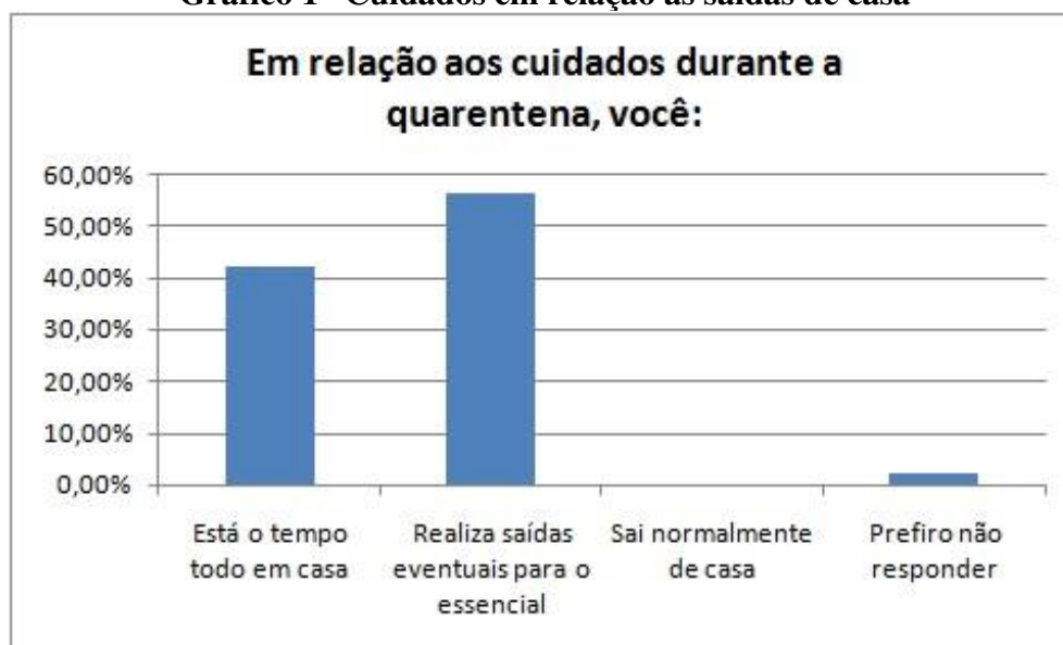
Gráfico 1 - Cuidados em relação às saídas de casa

A relação dos jovens com a cidade em meio à pandemia da COVID-19 pode ser lida e interpretada, como já anunciado, a partir de múltiplas lentes. Entende-se, portanto, que uma primeira análise deve ser feita a partir da relação de fluxo urbano desses jovens durante a vivência da quarentena. Para isso, questionamos os sujeitos com a seguinte pergunta: “em relação aos cuidados durante a quarentena, você:” e os jovens tinham três opções fechadas de respostas: a) está o tempo todo em casa; b) realiza saídas eventuais para o essencial; c) sai normalmente de casa. Ainda, visando à garantia ética do estudo, a opção “prefiro não responder” também estava disponível.