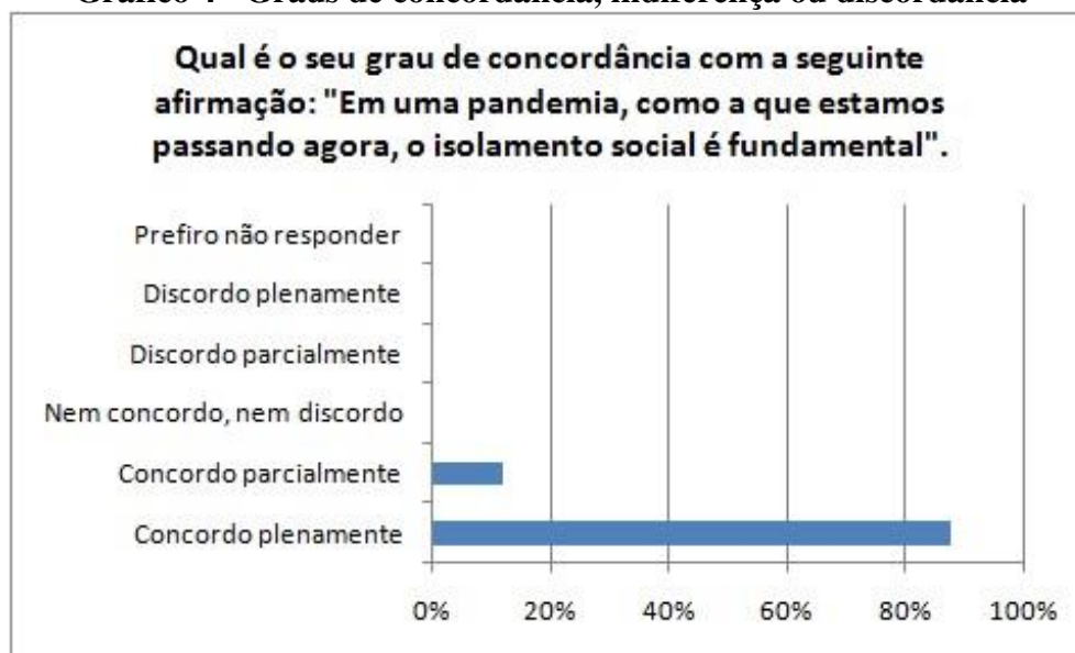
Gráfico 4 - Graus de concordância, indiferença ou discordância

Por fim, buscando garantir a confirmação dos dados anteriormente levantados, os jovens sujeitos foram apresentados a uma afirmação e deveriam, de acordo com a escala Likert (1932), manifestar seu grau de concordância (plena ou parcial), indiferença ou discordância (plena ou parcial). A afirmação era “em uma pandemia como a que estamos passando agora, o isolamento social é fundamental” e os dados podem ser observados no gráfico 4.