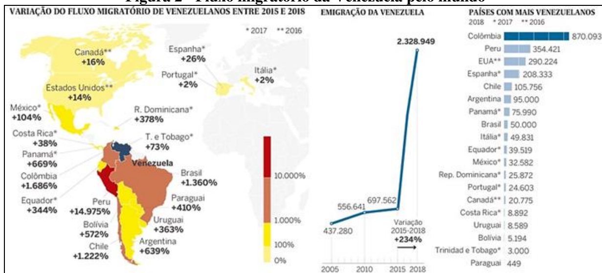
Figura 2 - Fluxo migratório da Venezuela pelo mundo

Sul/Sul apresenta maior adensamento direcionado para a América Latina como Colômbia, Peru, Equador, Chile, Brasil e na Argentina (GORTÁZAR, 2018) (Figura 2).