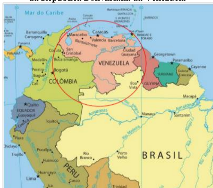
Figura 1 - Localização geográfica da República Bolivariana da Venezuela

De acordo com Coelho (2020), a Venezuela ou República Bolivariana da Venezuela, é um País independente localizado no norte da América do Sul. Limita-se ao norte com o mar do Caribe; ao sul com o Brasil, contemplando os estados de Roraima e Amazonas; a leste com a República Cooperativa da Guayana; e a oeste com a Colômbia sendo considerada uma região de fronteira (Figura 1).