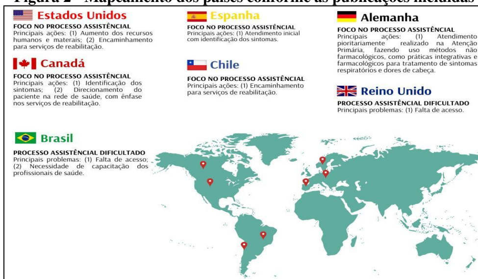
Figura 2 - Mapeamento dos países conforme as publicações incluídas

Os estudos foram publicados nos anos de 2021 (25%), 2022 (37,5%) e 2023 (37,5%), predominantemente nos Estados Unidos (25%) e no idioma inglês (87,5%). Outros países como Canadá, Chile, Alemanha, Brasil, Espanha e Reino Unido também tiveram representatividade na amostra (12,5%/cada), como mostra a figura 2.