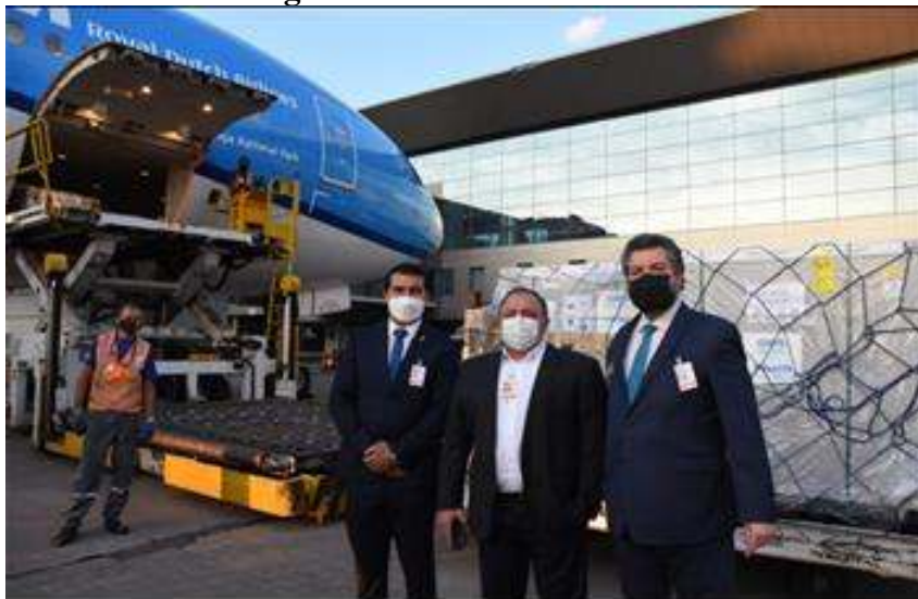
Figura 1 - Remessa de vacina

vacinação, é que o Brasil também está contribuindo para a imunização de países com menos recursos. É um elemento de solidariedade e de contribuição para a comunidade internacional (CRUZ, 2021).