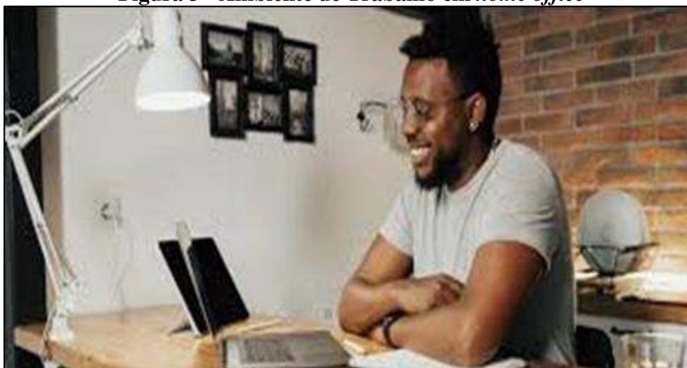
Figura 3 - Ambiente de Trabalho em home office