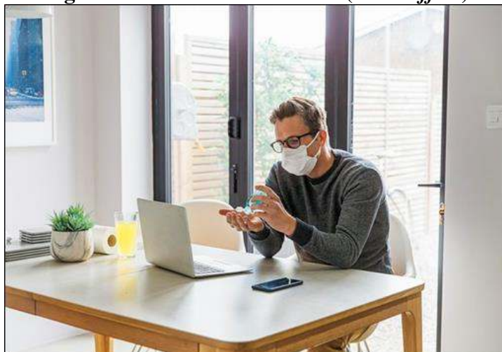
Figura 2 - O escritório em casa ( home office )

modalidade já existe desde a década de 1970. Na qual essa alcança uma proeminência maior nos últimos anos (DALLA ROSA, 2010).