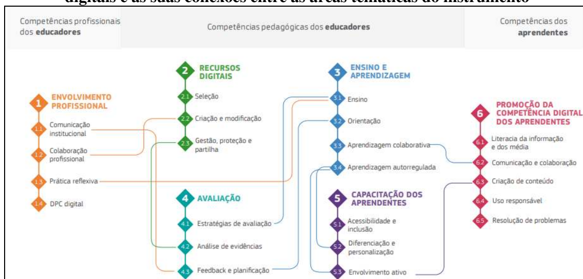
Figura 1 – Quadro DigCompEdu, identificando as competências digitais e as suas conexões entre as áreas temáticas do instrumento

adaptem suas metodologias de ensino de acordo com as necessidades dos alunos. Isso respeita o ritmo de aprendizado da turma, promove acessibilidade e inclusão, além de ampliar as opções de intervenções para proporcionar aprendizados mais significativos (LUCAS; MOREIRA, 2018). O Quadro é estruturado em três âmbitos, organizados em seis áreas temáticas que abarcam 22 competências elementares ou fundamentais (Figura 1). O framework foi traduzido em 2018 por Lucas e Moreira, quando da disponibilização de sua versão para a língua portuguesa de Portugal. Incluso, o documento propõe um modelo de autoavaliação no formato de questionário estruturado, para facilitar aos educadores identificarem seu atual nível de competências, e se desenvolverem nos campos identificados como prioritários, conforme uma escala de progresso e mensuração de aquisição de conhecimentos (LUCAS et al. , 2021; LUCAS; MOREIRA, 2018).