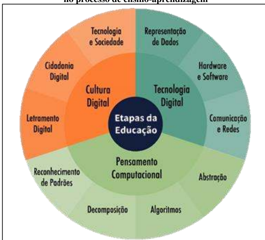
Figura 2 - A cultura da tecnologia no processo de ensino-aprendizagem