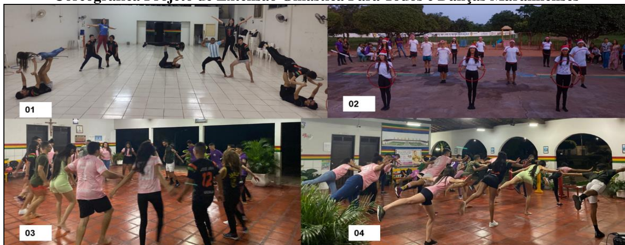
Figura 2 - Registro das vivências práticas e apresentação de uma Composição Coreográfica Projeto de Extensão Ginástica Para Todos e Danças Maranhenses

Durante as aulas, como também na primeira apresentação, os alunos foram incentivados a desafiar as possibilidades de movimento corporal, independentemente de suas habilidades, com respeito ao próximo, cooperação, elaboração de materiais alternativos e criatividade, Figura 2.