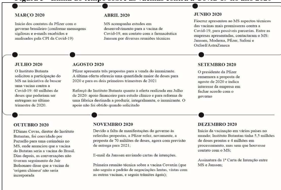
Figura 3 - Linha do tempo sobre as vacinas contra a Covid-19 no ano 2020

Fonte: Elaboração própria. Base de dados: Brasil (2021a).