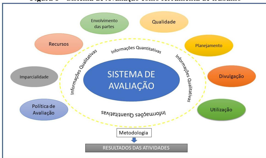
Figura 1 – Sistema de Avaliação como ferramenta de trabalho

Fonte: Elaboração própria. Baseada em: OCDE (2015).