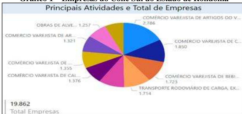
Gráfico 1 – Empresas do Cone Sul do Estado de Rondônia

Conforme relatório desenvolvido pela Junta Comercial do Estado de Rondônia – JUCER (2023), o Cone Sul do Estado possuía 7 (sete) municípios e 19.862 (dezenove mil oitocentos e sessenta e duas) micro e pequenas empresas até a data de 19/07/2023 (gráfico 1).