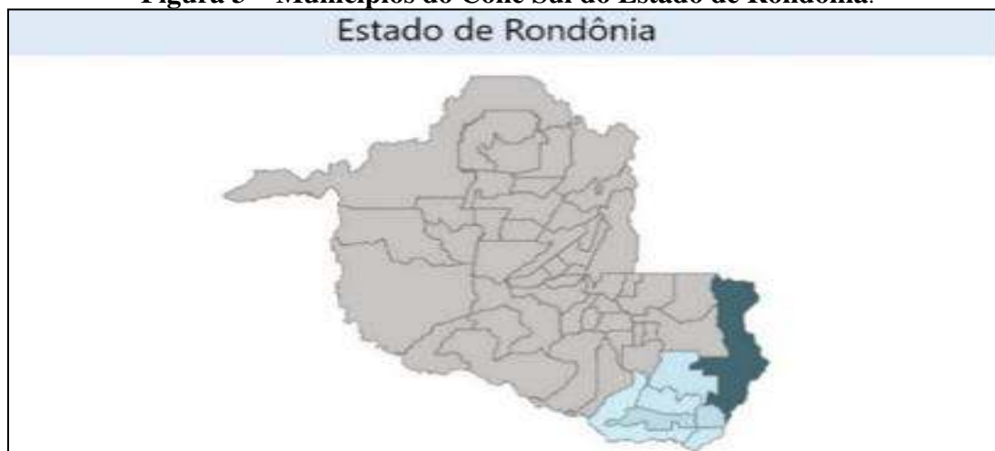
Figura 3 – Municípios do Cone Sul do Estado de Rondônia.

Nesse ponto, cabe ressaltar que a região do Cone Sul do Estado de Rondônia (figura 3), representa importante contribuição econômica para o Estado, destacando-se a produção do agronegócio e a atividade comercial como importantes agentes de alavancagem.