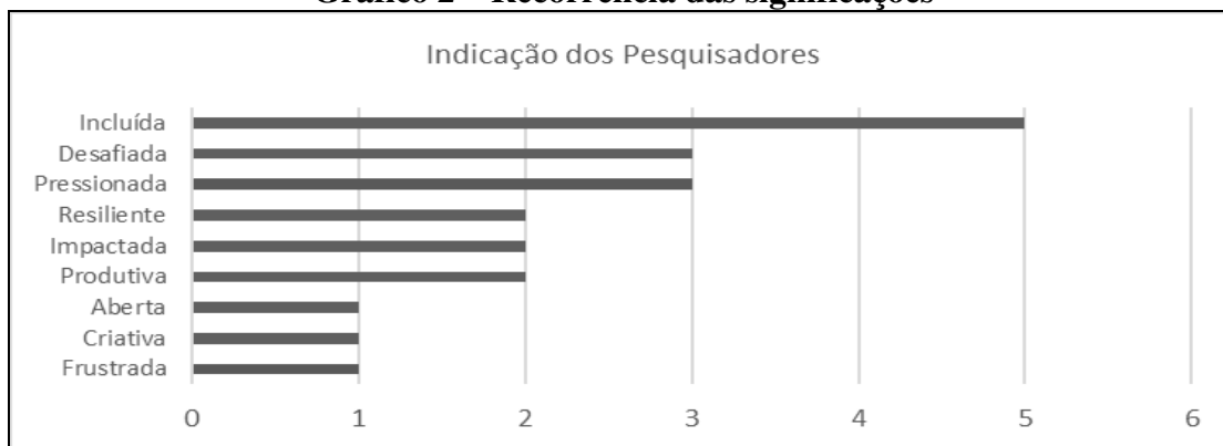
Gráfico 2 – Recorrência das significações

Uma experiência inédita, como a de cocriação de um curso, foi mobilizadora dos pesquisadores envolvidos. Ao serem abordados para que indicassem 2 (duas) significações que reconheçam ter sido mais expressivas ao longo da experiência de cocriação, foram selecionadas 9 (nove) pelos pesquisadores, conforme gráfico 2.