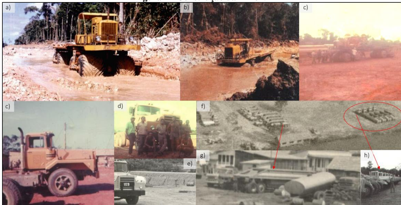
Figura 1 - Construção da BR-319