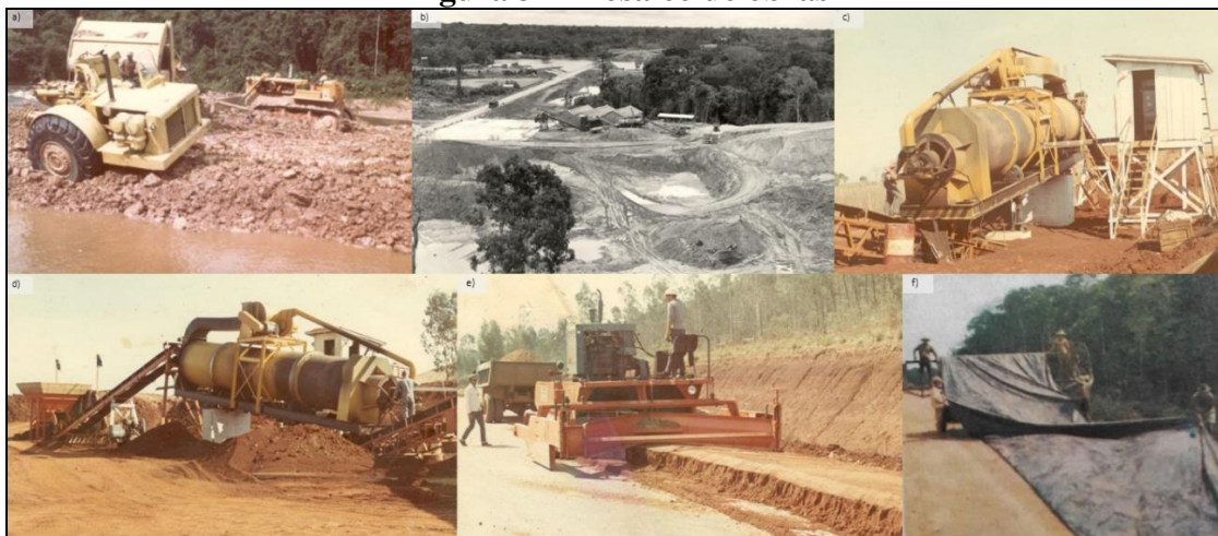
Figura 3 – Mosaico de obras

Nota: a) scraper e D8; b) terraplanagem; c) silo e d) silo para secagem do solo; e) terraplanagem com máquina especial (); f) máquina “sputnik” e operários colocando lonas na rodovia.