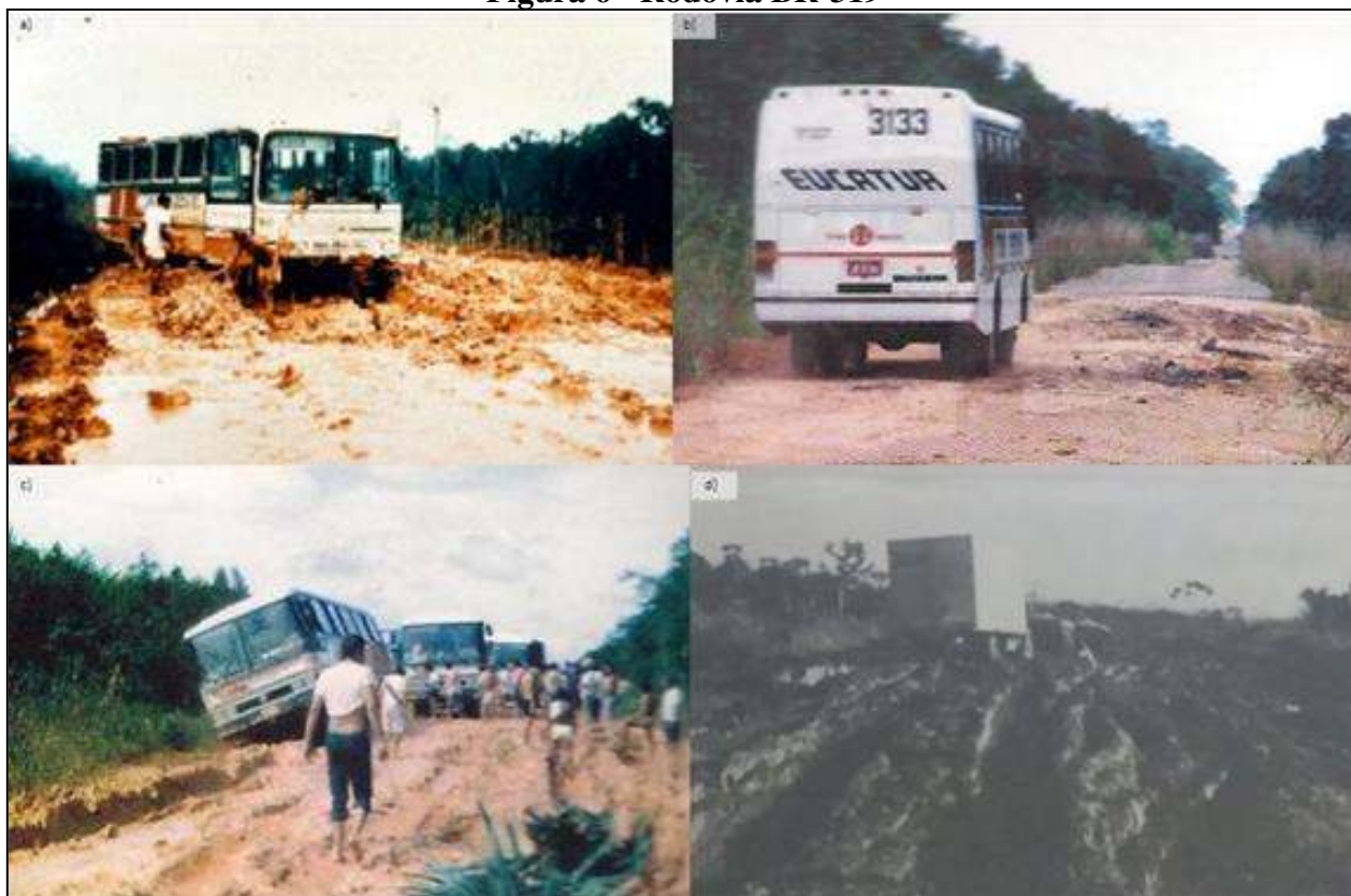
Figura 6 - Rodovia BR-319