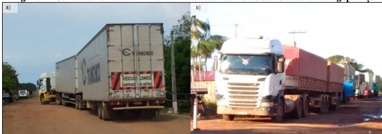
Figura 7 - Carretas na rodovia BR-319 no km 260 na vila de São Sebastião do Igapó Açu

O transporte de cargas e de passageiros apresenta uma série de limitações, primeiramente é permitido trafegar com veículos com Peso Bruto Total Combinado -PBTC de até 23T 8 e as viagens são realizadas entre 16h e até 40h nos meses de junho até dezembro.