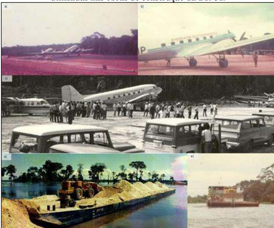
Figura 2 - Aeronaves e embarcações utilizadas nas obras de construção da BR-319

Nota: a), b) e c) aviões da construtora no canteiro de obras; d) balsa com areia; e) balsa com trator de esteira.