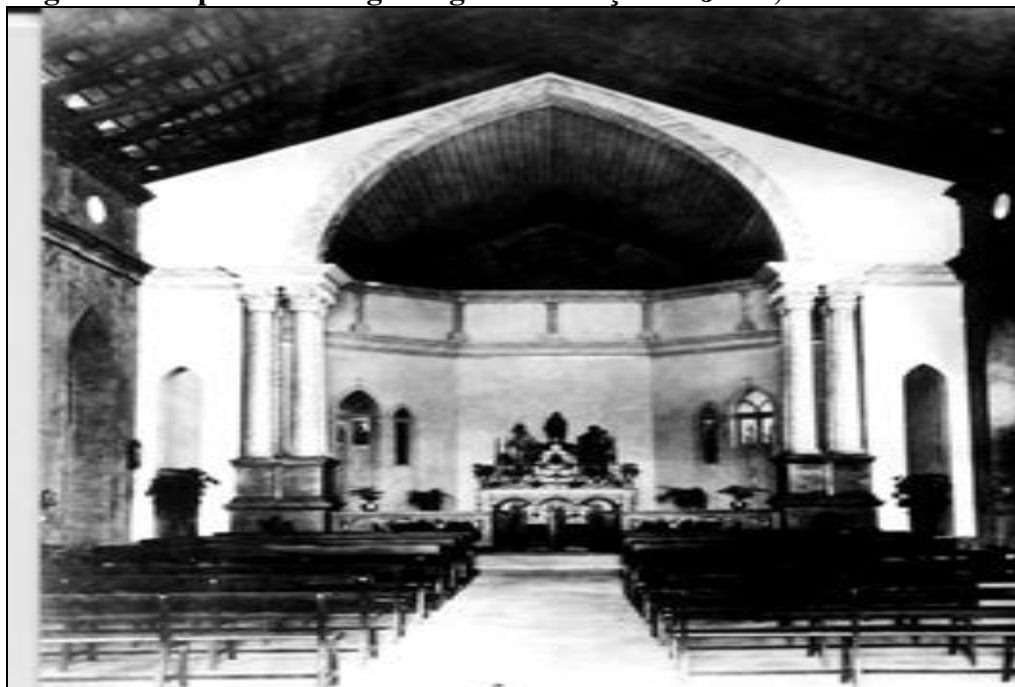
Figura 4 - Capela do Colégio Sagrado Coração de Jesus, em Teresina - PI