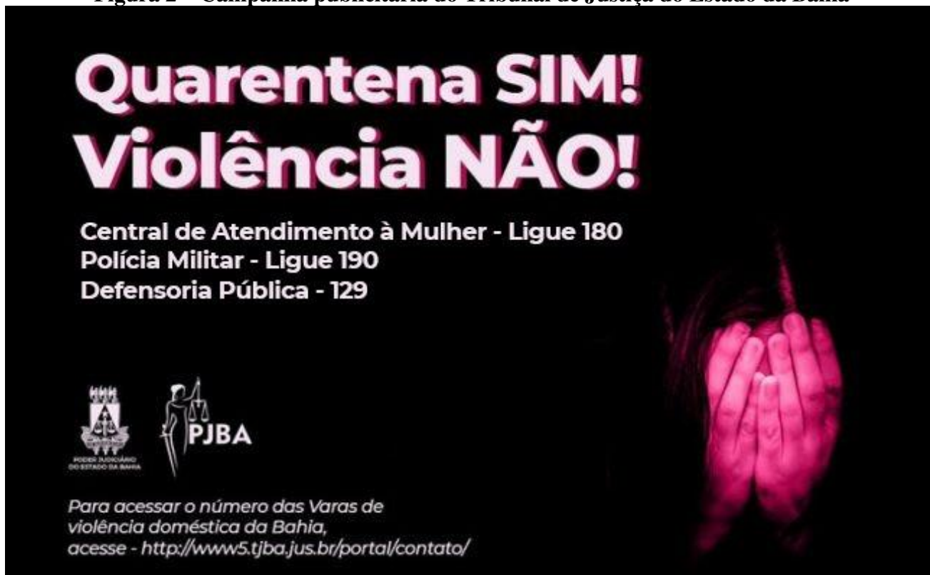
Figura 2 – Campanha publicitária do Tribunal de Justiça do Estado da Bahia

Assim, faz-se necessária a presença mais ativa do Estado, seja com a repressão aos autores, seja por campanhas de combate e enfrentamento à violência contra mulher, como é o caso do Tribunal de Justiça do Estado da Bahia (TJBA) que divulgou em seu portal eletrônico (figura 2) o seguinte slogan : “Quarentena sim! Violência não!” (TJBA, 2020).