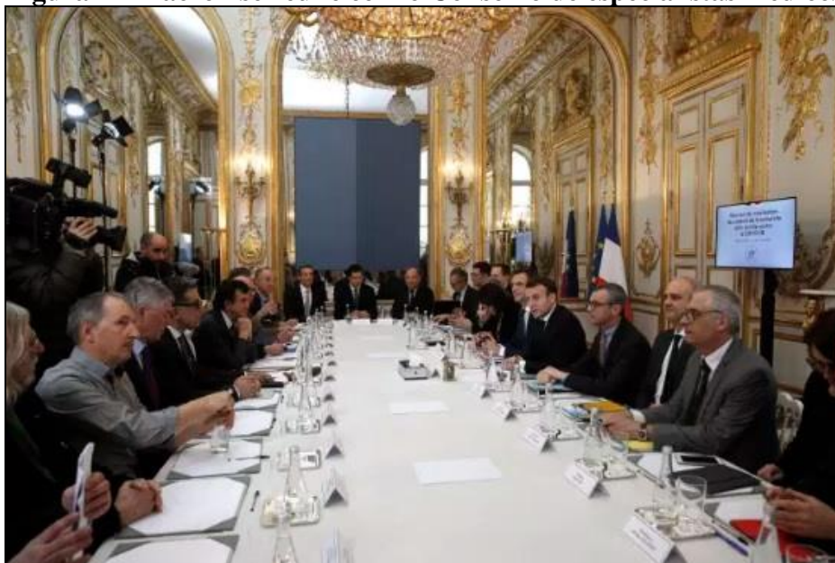
Figura 1 - Macron se reúne com o Conselho de especialistas médicos