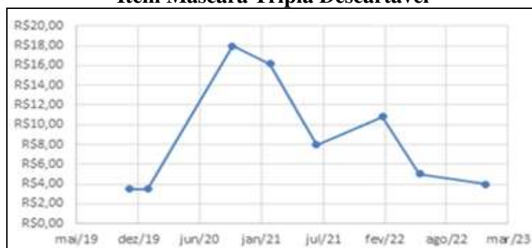
Gráfico 2 - Variação Preço do Item Máscara Tripla Descartável

Fonte: Elaboração própria. Base de dados: Sistema INFARMA.