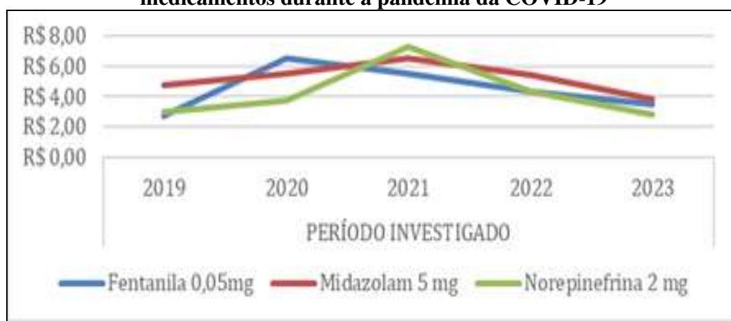
Gráfico 1 – Variações de preços dos medicamentos durante a pandemia da COVID-19

Fonte: Elaboração própria. Base de dados: Sistema INFARMA.