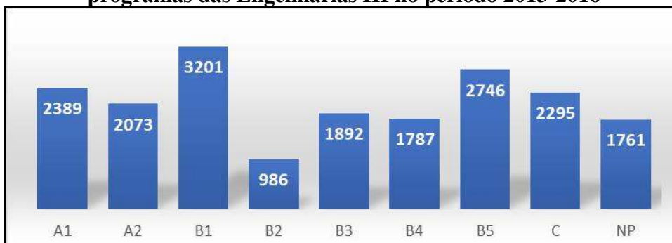
Gráfico 1 - Produção intelectual dos programas das Engenharias III no período 2013-2016

Fonte: Elaboração própria. Base de dados: CAPES (2019a).